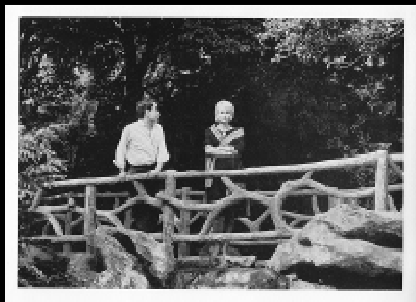
Un jeune homme, chemise ouverte et sans veste, vient s'accouder à la balustrade, à côté d'elle. Elle ne le regarde pas, il engage la conversation.

she had produced something of great originality. After its Paris premiere at the Studio Parnasse, the film was quickly recognised as avant garde . André Bazin enthused that "there is a total freedom of style, which produces the impression, so rare in the cinema, that we are in the presence of a work that obeys only the dreams and desires of its auteur with no other external obligations". It was through the praise of Bazin and Resnais that Varda found herself in with those fanatical young critics from Cahiers who recognised in La Pointe courte the embodiment of all their theorising.