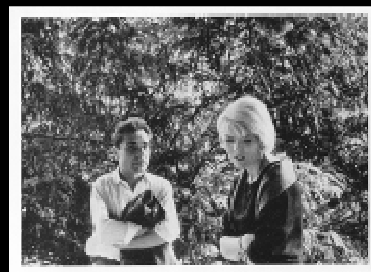
Cléo change du balustrade, tournant le dos au jeune homme. Mais peu après, il vient la rejoindre.

Born in Brussels in 1928, Varda went to Paris to study art history, initially, but turned to photography, taking classes at the Ecole de Vaugirard. Her first job was at the Théâtre national populaire (TNP), as official photographer, where