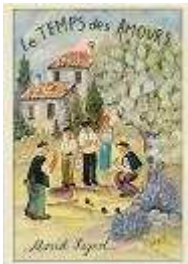
The glory of Marcel Pagnol