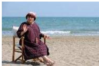
Agnès Varda on the beach